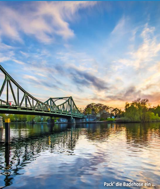
Pack' die Badehose ein ...

Mit der MS Klabaftermann von Magdeburg nach Potsdam